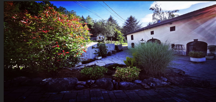
La Maison Thébaïde