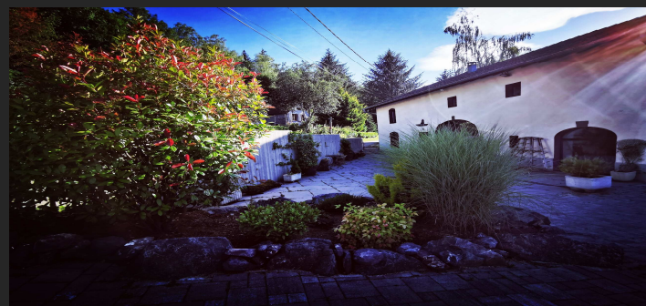
La Maison Thébaïde